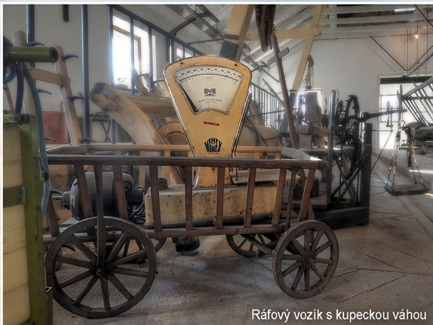
Ráfový vozík s kupeckou váhou