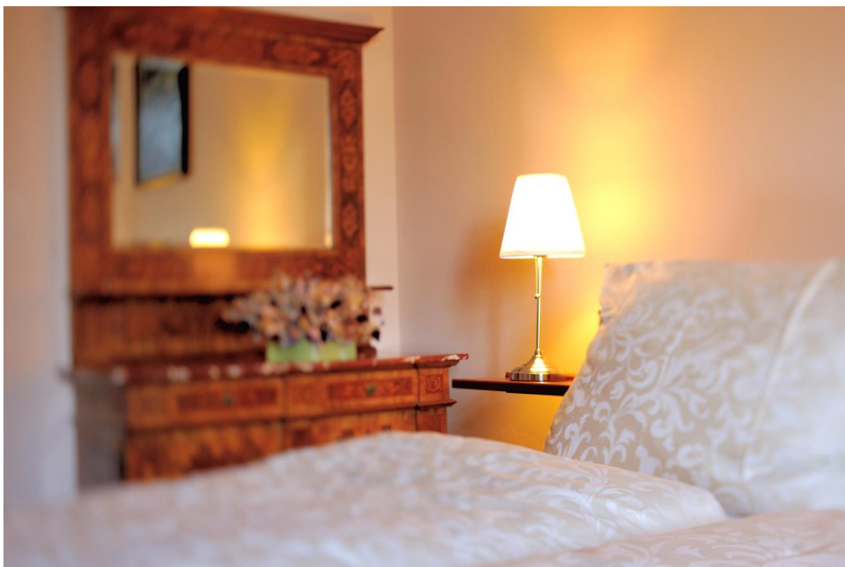
Ubytování v KP